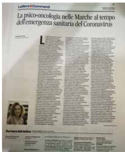
Corriere Adriatico Sabato 6 Giugno 2020